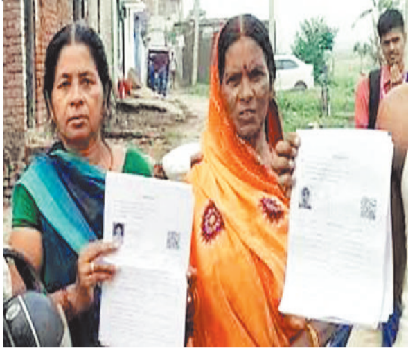
प्रमाणिक दस्तावेजों के साथ सुनवाई में शामिल होने नहीं पहुंचे, जिसके

एसआईआर से पहले प्रदेश में कुल 21230737 मतदाताओं के नाम सूची में दर्ज थे। निर्वाचन आयोग ने 23 दिसंबर 2025 को प्रारंभिक प्रकाशन के साथ ही 2734817 नाम हटाए थे, जिससे प्रदेश में मतदाताओं की संख्या घटकर 18495920 रह गई थी। इस तरह एसआईआर के दौरान मतदाता सूची से हटाए गए 27.34 लाख मतदाताओं को देबारा मतदाता सूची में शामिल होने के लिए 14 फरवरी तक दावा आपत्ति मंगाए गए थे, वहीं इनमें कैटेगरी बी एवं सी में शामिल मतदाताओं को नोटिस जारी कर प्रमाणिक दस्तावेजों की सुनवाई में शामिल होने कहा गया था। हालांकि सूत्र के अनुसार जितने मतदाताओं को नोटिस जारी हुआ है, उनमें से 50 प्रतिशत भी मतदाता