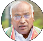
- मल्लिकार्जुन खरगे, अध्यक्ष, कांग्रेस

शिलांग से लोकसभा सांसद रिंकी ए.जे. सिंगकॉन के निधन से गहरा दुःख व्यक्त करते हैं। मेघालय की जनता और शिलांग के क्षेत्र में उनके योगदान को हमेशा याद रखा जाएगा। उनके परिवार, मित्रों और समर्थकों के प्रति हमारी गहरी संवेदना।