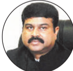
- धर्मन्त प्रधान, केंद्रीय शिक्षा मंत्री

जब पूरा विद्व भारत के वैश्विक नेतृत्व, नवाचार और प्रौद्योगिकी वृष्टि की सराहना कर रहा है, तब हाल ही गांधी और कांग्रेस एक बार फिर देना को शर्मसार करने की राजनीति में लिप्त दिखे, जिसने सत्ता की मुख इतनी गहरी है कि राष्ट्रीय सम्मान भी दांव पर लगाने से इन्हे गुरेज नहीं है।