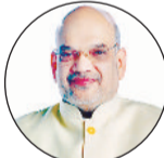
-अमित शाह, केंद्रीय गृह मंत्री

पहले सीमावर्ती गांवों को न केवल उनकी भौगोलिक स्थिति बल्कि विकास में पीछड़ान के कारण भी अतिम गांव कहा जाता था। लेकिन प्रधानमंत्री मोदी जी ने जीवंत ग्राम कार्यक्रम के तहत उन्हें हर सुविधा उपलब्ध कराकर उन्हें पहले गांवों में बदल दिया।